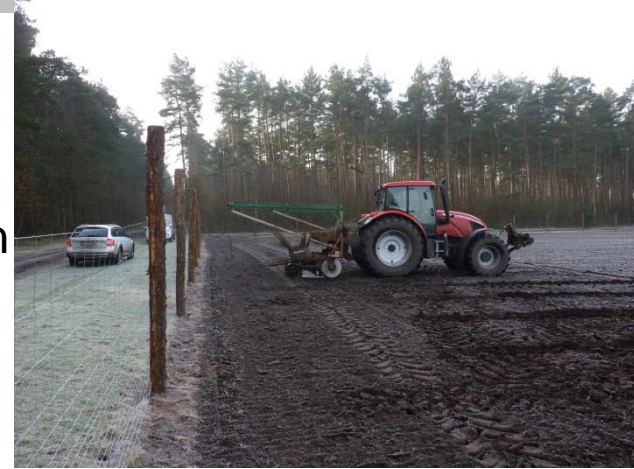
Abbildung: Pflanzmaschine im Einsatz

Durch Erstaufforstung von insgesamt 12 Hektar Ackerflächen sind neue Laubwälder begründet worden, in denen zukünftig neben Hauptbaumarten wie Eichen auch bunt gemischte Waldränder aus Sträuchern und Wildobstbäumen wachsen.