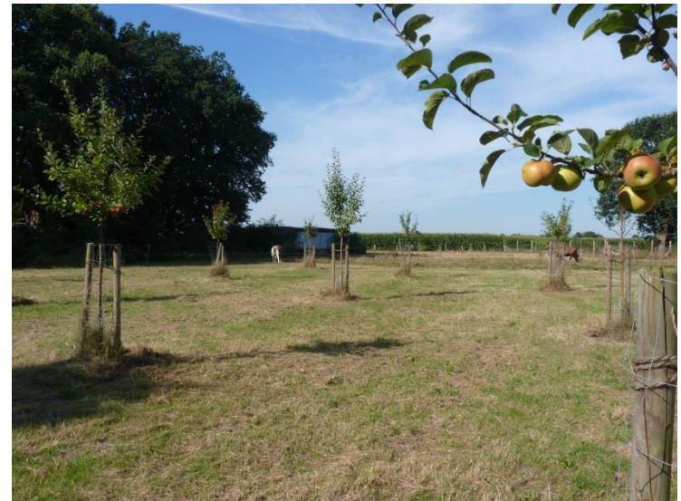
Abbildung: Streuobstwiese im vierten Jahr nach Pflanzung

Insgesamt wurden vier neue Streuobstwiesen im Heidekreis mit insgesamt 3,9 Hektar Fläche angelegt.